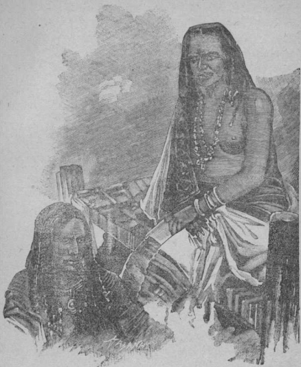
ΑΙΓΥΠΤΙΑΙ ΕΝ ΤΗ ΑΡΧΑΙΟΤΗΤΙ