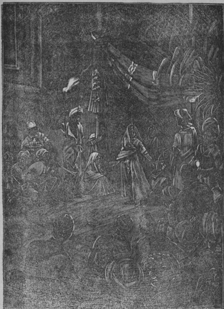
ΕΙΣ ΤΑ ΕΝΔΟΤΕΡΑ ΤΩΝ ΙΝΔΙΩΝ ΤΟ ΤΑΞΙΔΙΟΝ ΤΟΥ ΤΣΑΡΕΒΙΤΣ ΤΟΜ. Β' 12