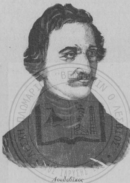
(πατήρ τοῦ Ὡθωνος)