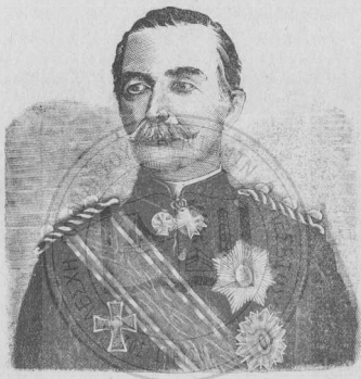
Ὁ στρατηγὸς Δημήτριος Γρίβας