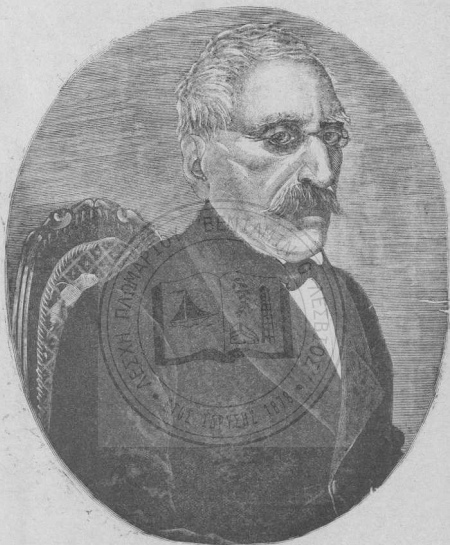
Παραγωγής Γ. Α. Βάρβογλης