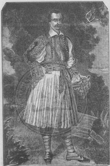
Ὁ βασιλεὺς Ὀθων