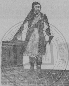
Ὁ Στρατηγὸς Χριστόδουλος Χατζῆ-Πέτρος