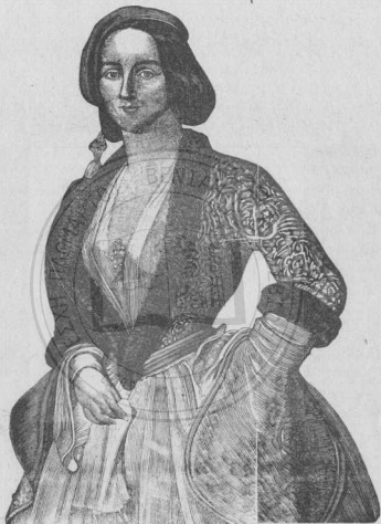
Ἡ βασίλισσα Ἀπολλωνία