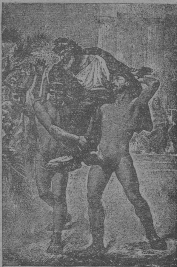
Ὁ Θολαμβος «ΔΙΑΓΟΡΑ» τοῦ Ῥοδίου

ΕΚΔΙΔΟΜΕΝΑ ΥΠΟ ΤΟΥ ΓΥΜΝ. ΣΥΛΛΟΓΟΥ «ΔΙΑΓΟΡΑ»