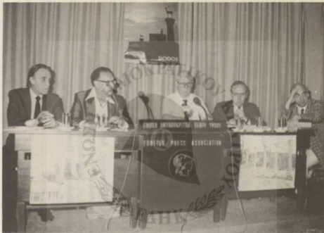
Η ομάδα των ομιλητών: Από αριστερά προς τα δεξιά Λ. Βασιλικόπουλος, Ναύαρχος, Επίτιμος αρχηγός Γ.Ε.Ν., Β. Μαθιόπουλος, Δημοσιογράφος, καθηγητής Παντείου Πανεπιστημίου, ο Πρόεδρος Ι. Ζιγδής, Ν. Κουρής, Πτέραρχος, επίτιμος αρχηγός Γ.Ε.ΕΘ.Α. και Νεοκλής Σαρρής, Καθηγητής Παντείου Πανεπιστημίου (ειδικός Τουρκολόγος).