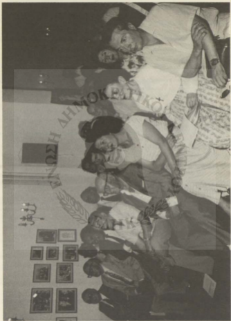
Αποψη του ακροατηρίου.