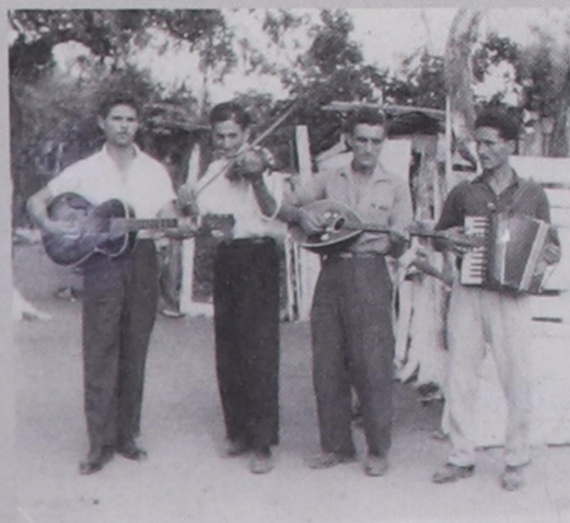
1958. Μαριώτες οργανοπαίχτες