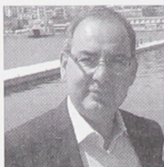
Του Κωνσταντίνου Π. Παπακοσμά*

Η 24 Μαΐου 1981 ήταν μια σημαντική μέρα για τη Θάσο την Καβάλα αλλά και για ολόκληρη την χώρα. Το πρώτο Ελληνικό πετρέλαιο ήταν έτοιμο προς εκμετάλλευση. Τον Μάιο του 1981 έγιναν τα εγκαίνια των εγκαταστάσεων επεξεργασίας των Πετρελαίων στην Νέα Καρβάλη, αλλά και των εξεδρών στον Πρίνο της Θάσου. Στο κείμενο αυτό αναφερόμαστε στο γεγονός εκείνο αλλά και καταγράφουμε συνοπτικά την ιστορία των Ελληνικών Πετρελαίων μέχρι τότε.