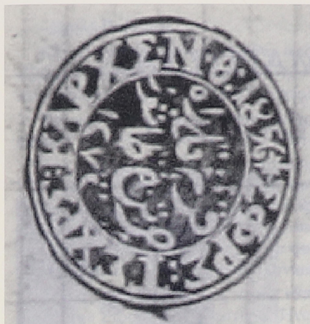
Η σφραγίδα της κοινότητας Κακιράχης 1856