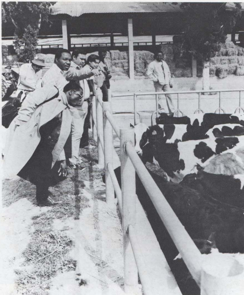
Οι φοιτητές του πανεπιστημίου του Reading επισκέπτονται την αγέλη γαλακτοπαραγωγής κατά την ξενάγησή-τους στους χώρους της Σχολής.

Οι συνεχείς ερωτήσεις και οι ζωηρές συζητήσεις ήταν το χαρακτηριστικό της επίσκεψης των φοιτητών αυτών, οι οποίοι και συγκέντρωσαν έναν εντυπωσιακό όγκο πληροφοριών για την γεωργία της Ελλάδας σε λίγες ώρες.