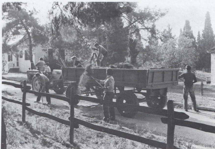
Οι κάτοικοι της Σχολής, νέοι και γέροι, την ώρα που δουλεύουν όλοι μαζί.

Νωρίς το πρωί κάποιο Σάββατο, οι κάτοικοι της Γεωργικής Σχολής, βγήκαν από τα σπίτια τους και όλοι μαζί άρχισαν να καθαρίζουν τους χώρους της Σχολής γύρω από τα σπίτια τους. Δεκάδες τσάπες, φτυάρια, τσουγκράνες και καροτσάκια έκαναν ξαφνικά την εμφάνισή τους, και μέσα σε λίγες ώρες στίβες ολόκληρες από αγριόχορτα και άλλα σκουπίδια φορτώθηκαν σε μία πλατφόρμα για πέταμα. Η Σχολή έλαμπε από καθαριότητα. Η ημέρα αυτή καθαριότητας, οργανώθηκε από μία ομάδα κατοίκων της Σχολής, με επικεφαλής τους Κώστα Ευαγγέλου, Γιώργο Παπακωνσταντίνου και Νίκο Βαλασιάδη. Η ίδια ομάδα οργάνωσε επίσης και ένα γλέντι το ίδιο βράδυ, για να γιορτάσουν την καινούρια όψη της Σχολής. Οι κάτοικοι της Σχολής που παρεβρέθησαν στο γλέντι αυτό έφεραν διάφορους μεζέδες τους οποίους όλοι... έτιμησαν δεόντως και το βράδυ έκλεισε με Ελληνικούς χορούς.