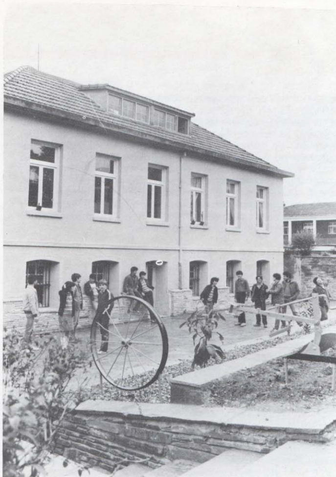
Μαθητές της Αμερικανικής Γεωργικής Σχολής σ' ένα διάλειμμά-τους στο καινούριο πάρκο γύρω από το James Hall.

Αψηφώντας φωτιά, πόλεμο και νομοθεσία, το James Hall συνεχίζει την παράδοσή-του σαν το κύριο κτίριο του Ακαδημαϊκού τμήματος της Σχολής.