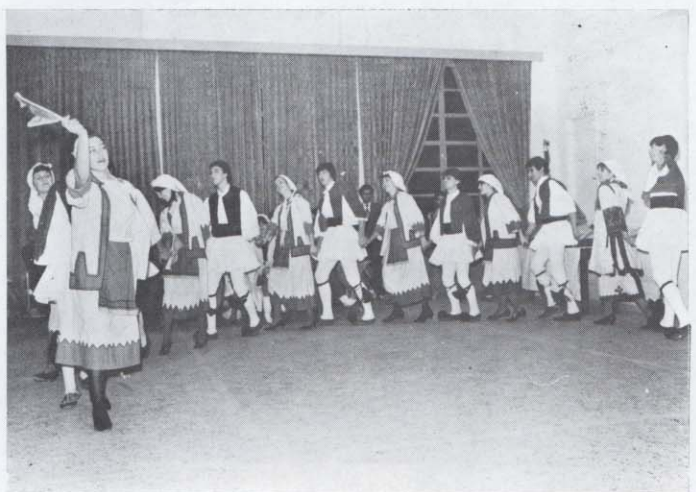
Μαθητές της Σχολής στο ψυχαγωγικό πρόγραμμα με παραδοσιακούς Ελληνικούς χορούς που οργάνωσαν για τους γονείς-τους.