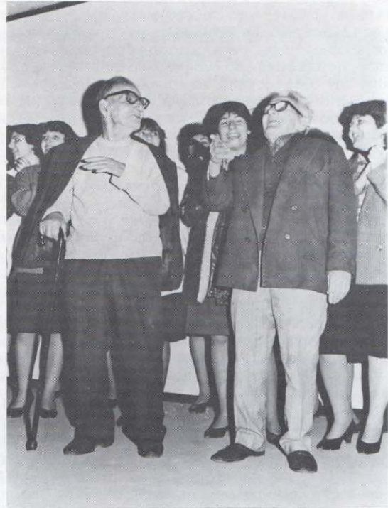
Δύο τρόφιμοι ενός γηροκομείου της περιοχής συνοδεύουν τους μαθητές της Αμερικανικής Σχολής σε ένα τραγούδι.

Οι 24 μαθητές που αντιπροσώπευαν την Αμερικανική Γεωργική Σχολή έφεραν πίσω στη Σχολή 17 μετάλλια, από τα οποία 6 ήταν για πρώτες θέσεις σε διάφορα αγωνίσματα.