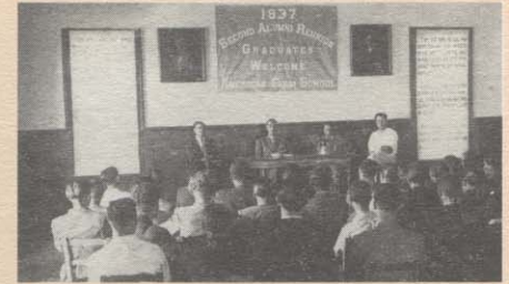
Η δεύτερη επίσημη Συνάντηση Αποφοίτων έγινε το 1937.

Πού έμεναν οι απόφοιτοι μετά την αποφοίτησή τους; Τρία τέταρτα του συνόλου έμεναν στη Βόρειο Ελλάδα. Είκοσι έμεναν στην Αθήνα ή σε κάποιο ελληνικό νησί, 22 στη Βουλγαρία, 4 στη Γιουγκοσλαβία, από ένας στην Αργεντινή, Αρμενία, Αυστρία, Αίγυπτο, Αγγλία, Γαλλία, Τζαμάικα, Παλαιστίνη, Ρουμανία, Βόρειο Αφρική, Συρία και στον Καναδά, και 23 στις Ηνωμένες Πολιτείες. Και με τι ασχολούνταν; Ένας από τους κυριότερους στόχους της Αμερικανικής Γεωργικής Σχολής ήταν πάντοτε να προωθηθεί καριέρες στον τομέα της γεωργίας. Μετέπειτα έρευνες, που έγιναν από τη δεκαετία του 1950 ως τη δεκαετία του 1990 και αφορούσαν τους αποφοίτους, απέδειξαν ότι περίπου το 60% των αποφοίτων σε σταθερή βάση ακολουθούν καριέρες σχετικές με τη γεωργία. Από τις πληροφορίες του καταλόγου του 1938 προκύπτουν τα