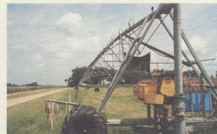
Σύστημα ποτίσματος που χρησιμοποιεί η Γεωργία Ακριβείας.

Ακριβείας: Η Επόμενη Επανάσταση στη Γεωργία». Σε αυτή την επιστημονική συνάντηση, επιστήμονες και σπουδαστές από την Ελλάδα, την Π.Γ.Δ.Μ. και τις ΗΠΑ είχαν την ευκαιρία να ενημερωθούν για τα αποτελέσματα της εφαρμοσμένης έρευνας, που διενεργεί πάνω σ' αυτό το θέμα, το University of Georgia USA, ένα από τα κέντρα έρευνας για τη Γεωργία Ακριβείας σε όλον τον κόσμο. Ο Δρ. Γεώργιος Βελλίδης, Αναπληρωτής καθηγητής Γεωπονίας και κάτοικος Θεσσαλονίκης, παρουσίασε τις βασικές έννοιες, τα εργαλεία και τα αποτελέσματα των ερευνών πάνω σ' αυτήν την πρωτοποριακή γεωργική επιστήμη. Στόχος της είναι να βελτιστοποιήσει την απόδοση της γεωργικής παραγωγής και ταυτόχρονα να προστατεύσει το περιβάλλον, εφαρμόζοντας μεθόδους μειωμένων εισροών. Ο συνεργάτης του Δρ. Γιώργου Βελλίδη, Δρ. Craig Kvien, μίλησε κυρίως για συγκεκριμένες μεθόδους που χρησιμοποιούν Συστήματα Προσδιορισμού Γεωγραφικής Θέσης (GPS) και Συστήματα Γεωγραφικών Πληροφοριών (GIS). Ο Δρ. Βελλίδης, σε συνεργασία με το Διευθυντή Σπουδών του Κολλεγίου, Δρ. Ευάγγελο Βέργο και τον καθηγητή Δρ. Αθανάσιο Γκέρτσον, εισήγαγε -για πρώτη φορά στη γεωργική εκπαίδευση στην Ελλάδα και την ευρύτερη περιοχή των Βαλκανίων- το μάθημα της Γεωργίας Ακριβείας, που θα διδάσκεται στο Dimitris Perrotis College of Agricultural Studies από